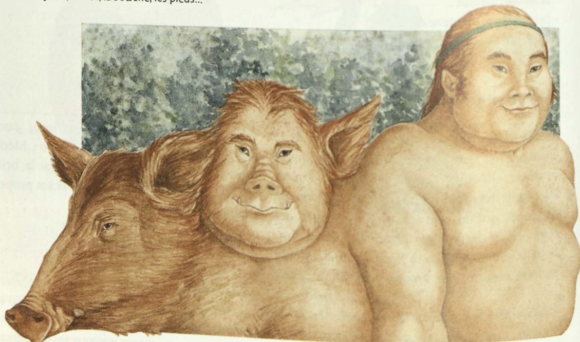
Isabelle Forestier, La métamorphose du porc en homme , illustration, 1992.